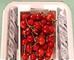
A 500g バラ詰