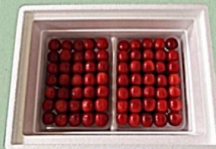
D 500g パック×2詰