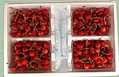
E 500g バラ×4詰