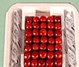
B 500g パック詰