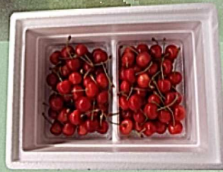
C 500g バラ×2詰